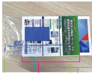
フィルムラッピング 同封印刷物 会誌