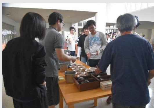
シダックスの炊き出し